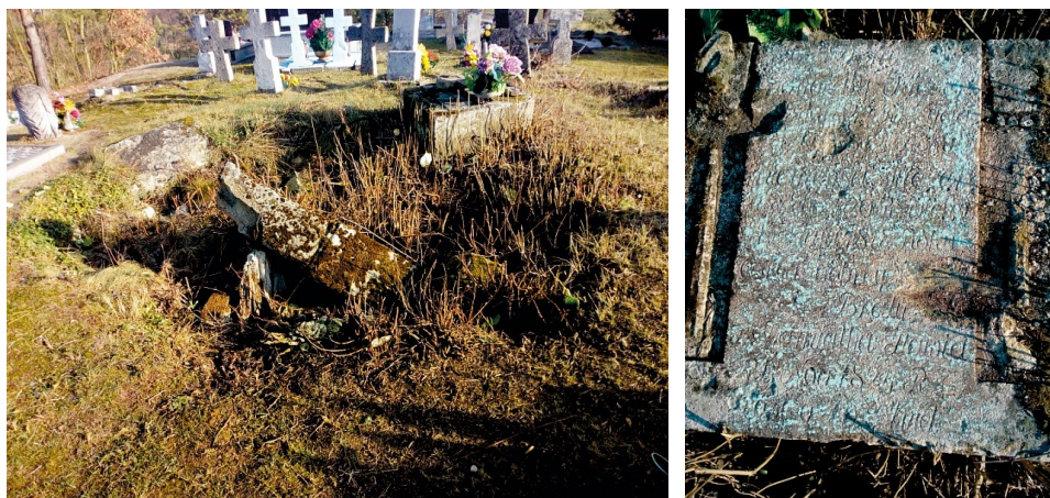
Zniszczony rodzinny grobowiec Mezerów na cmentarzu w Mostach Małych (po lewej) i trudna do odczytania tablica z inskrypcją (po prawej). Źródło: Fotografia Z. Pizun (17 X 2019 i 21 I 2020)

odnotowano w roku 1854 115 . Rok 1855 przynosi informację o nieokreślonych w spisie spadkobiercach Karola Mezera 116 .