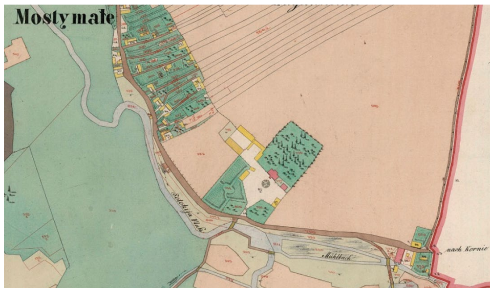
Mosty Małe – dwór, młyn wodny i część wsi.

matyzować i ukierunkować dalszy proces badawczy nad przeszłością Wierzbicy i Mostów Małych, a także niektórych sąsiednich miejscowości. Podczas analizy źródeł historycznych autorzy zauważyli, że pewne fakty, podawane od pokoleń w literaturze historycznej, nie są całkowicie prawdziwe i należy je skorygować lub chociaż podać w wątpliwość. Przede wszystkim dotyczy to rodziny Paparów, której jednak, pomimo licznych związków małżeńskich z rodziną Lityńskich, nie można określić jako właścicieli Wierzbicy. Niejasne wydało się określanie przez wielu autorów Mostów Małych jako Woli Machnowskiej, gdyż nie znajduje to w pełni uzasadnienia w dokumentach archiwalnych. Publikację wzbogaciły współczesne fotografie, ukazujące, co dzisiaj pozostało po dawnych właścicielach majątków. Dwór w Mostach Małych, jako mniej znany od wierzbickiego, a w dodatku nieistniejący, ukazany został dodatkowo na mapie katastralnej z połowy XIX w. Niniejszy artykuł jest w zasadzie wstępem do dalszych, wnikliwszych badań historycznych i poszukiwań informacji na temat właścicieli ziemskich, niemniej jednak autorzy mają nadzieję, że wniosł on nowe, interesujące informacje do historiografii regionalnej.