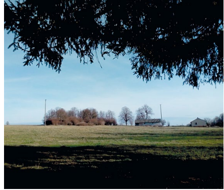
Opuszczony i zniszczony pałac w Wierzbicy (po lewej) i miejsce po dworze w Mostach Małych (po prawej) – stan obecny. Źródło: Fotografia Z. Pizun (21 I 2020 i 17 X 2019)

lokalnej „Miasteczko” (obecnie południowa część wsi Potoki). Szczególne znaczenie na pewno miał odbywający się w miasteczku targ 7 , jako jeden z nielicznych w tej części Galicji 8 .