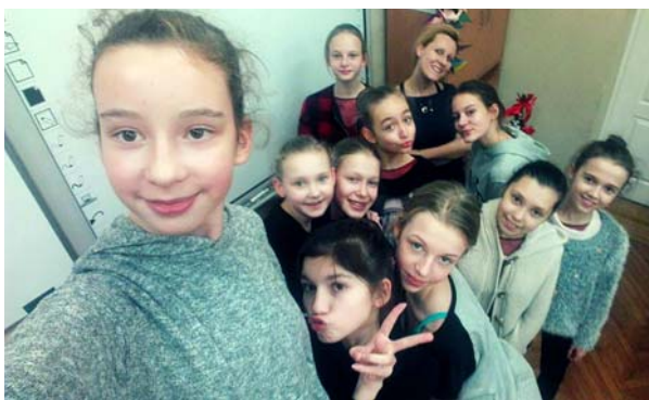
Ryc. 8. Uczestniczki projektu „Żydowski Poznań”