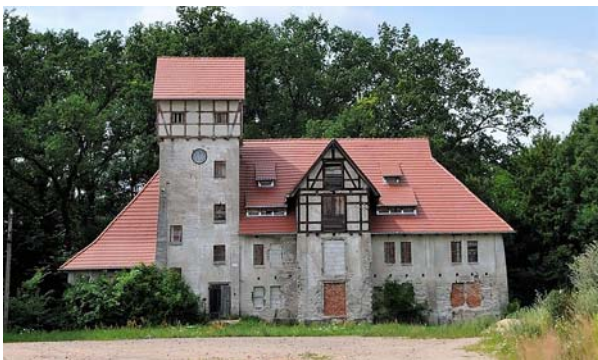
Ryc. 3. Spichlerz w Jankowie Drawskim wg projektu W. Gropiusa z 1905 r. (fot. E.S.)

Fig. 3. The Granary in Janków Drawski, according to a design by W. Gropius from 1905 (phot. by E.S.)