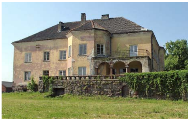
Ryc. 1. Pałac Kleniewskich w Szczekarkowie Fig. 1. The Kleniewski family palace in Szczekarków