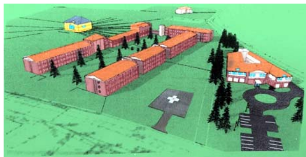
Ryc. 2. Propozycja uczniów rewaloryzacji obiektu. Fig. 2. The students’ proposal of the site’s revalorisation.