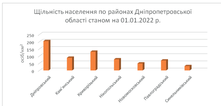
Рис. 1. Щільність населення по районах Дніпропетровської області станом на 01.01.2022 р.

Аналіз щільності населення по районах області свідчить, що її показники залежать, перш за все, від людності міських поселень на їх території. Порівняння цього показника з минулорічними даними вказує на зменшення щільності по районах в межах 1–3 осіб/км 2 . Такі зміни за один рік є доволі відчутними. Але можна передбачити, що ще більших змін цей показник зазнає внаслідок сучасного військового стану.