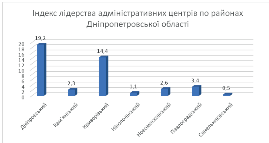
Рис. 3. Індекс лідерства адміністративних центрів по районах Дніпропетровської області

Застосування класичного підходу для визначення урбанізованості території не завжди відрізняється достатньою репрезентативністю. Наприклад, Кам'янський район (86%), де населення найбільшого міста – Кам'янського (226,8 тис. осіб) у чотири рази менше за м. Дніпро (968,5 тис.) за рівнем урбанізованості лише на 4% поступався Дніпровському району (90%), або знаходився на одному рівні з Криворізьким районом (87%), хоча поступався м. Кривий Ріг (603,9 тис.) у 2,7 рази. Ще більші диспропорції були помітні в Нікопольського (80%) та Павлоградського (78%) районах, де райцентри у дев'ять разів за людністю поступалися м. Дніпро, а за урбанізованістю відставали лише на 10–12% (табл. 1).