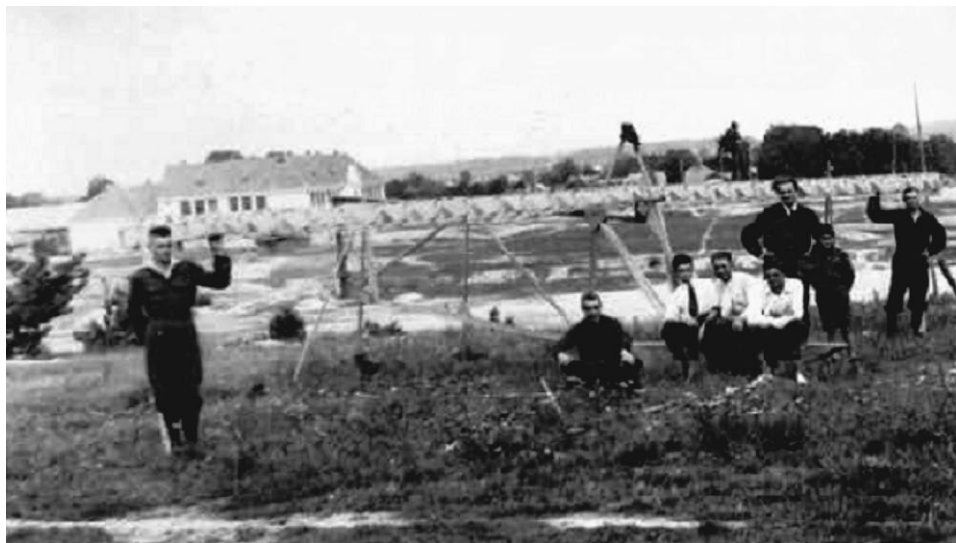
Ostatnie prace nad wykończeniem szybowca (rok szkolny 1930/1931).