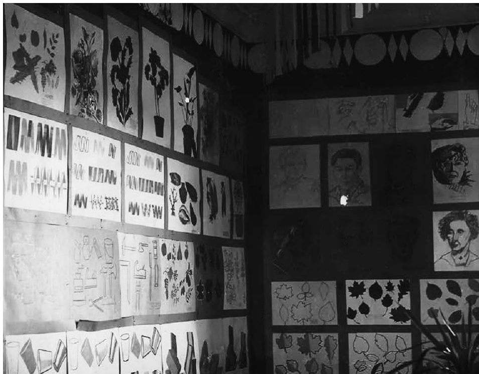
Wystawa prac uczniów Gimnazjum im. Bartosza Głowackiego. Źródło: „Kronika Państwowego Gimnazjum im. Bartosza Głowackiego w Tomaszowie Lubelskim, założona w 1918 roku”, t. 1, „1918-1929”, s. 242