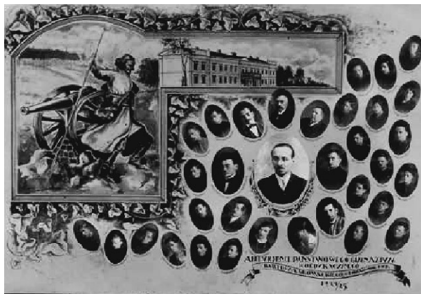
Maturzyści rocznik 1925. Źródło: „Kronika...”, t. 1, „1918-1929”, s. 86