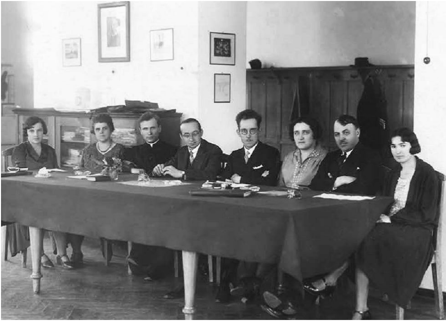
Państwowa Komisja Egzaminacyjna (maj 1930). Źródło: „Kronika...”, t. 2, „1929-1939”, s. 26