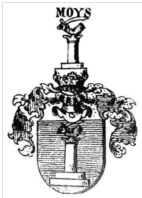
Foto 1. Semnul nobiliar al Familiei Moisil: un scut în câmpul căruia apare o coloană verticală timbrată de brațul unui cavaler medieval cu o sabie în mâna dreaptă (prelucrare proprie)

1900, Iuliu Moisil menționează atât diplomele prin care strămoșii săi au fost ridicați la rang de nobili români cât și semnul nobiliar distinctiv acordat cu prilejul înnobilării 6 .