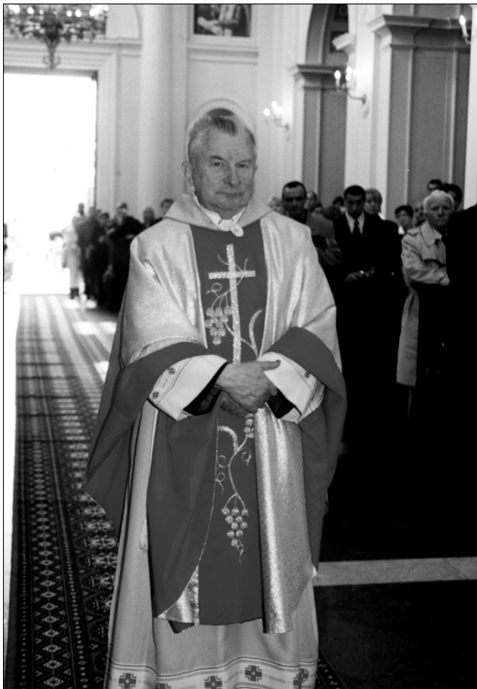
Fotografia 5. W kościele Św. Anny w Wilanowie w 2001 r.