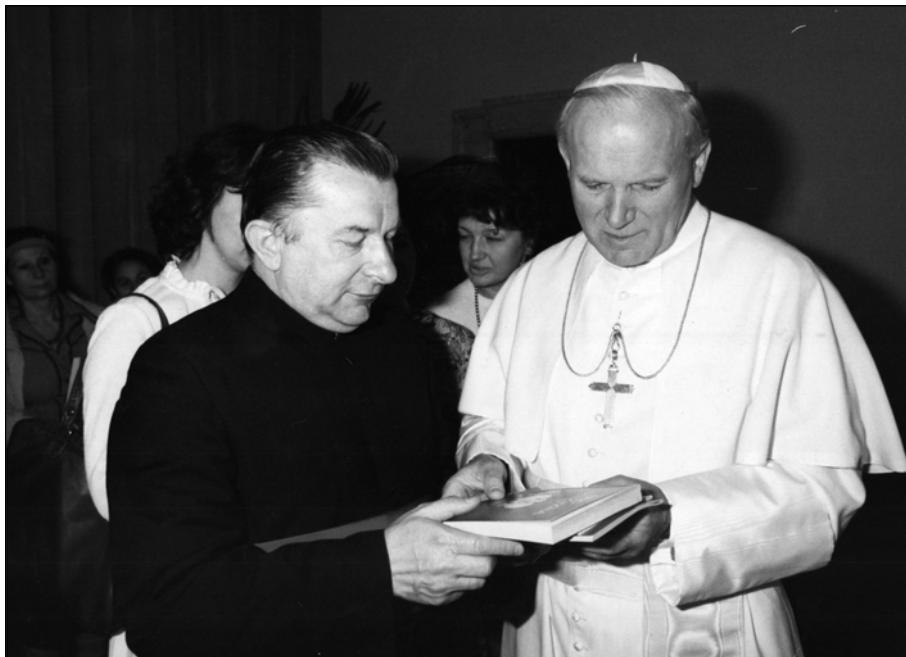
Fotografia 4. Prezentacja Janowi Pawłowi II pierwszego wydania kazań ks. Jerzego Popiełuszki w 1985 r. na Watykanie.