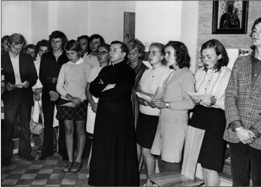
Fotografia 2. Jedno ze spotkań duszpasterstwa akademickiego, jakie odbywały się w latach 1961–1979 w Betanii przy ul. Książęcej w Warszawie.