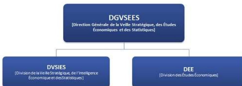
Figure 4 : dispositif institutionnel de l'IE