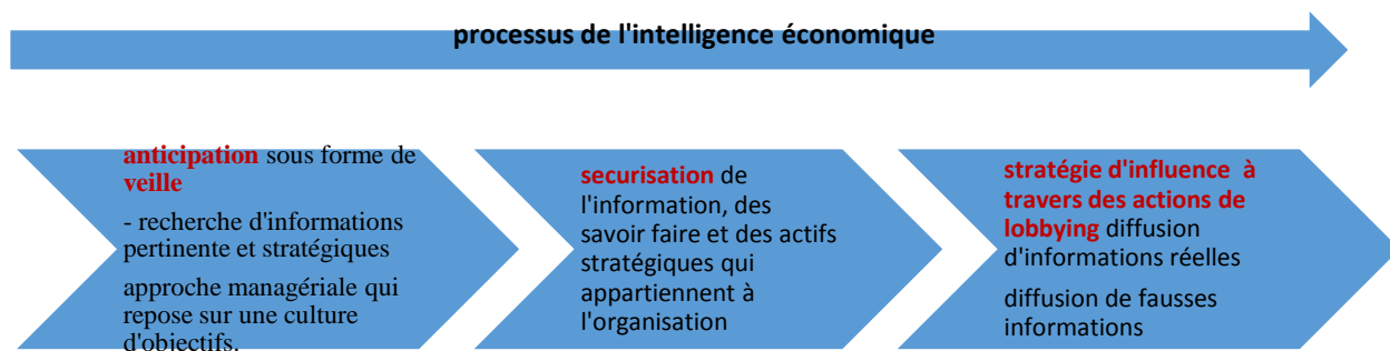
Figure 2 : Démarche de l'intelligence économique

Source : Jakobiak F. (2009) , « l'intelligence économique »