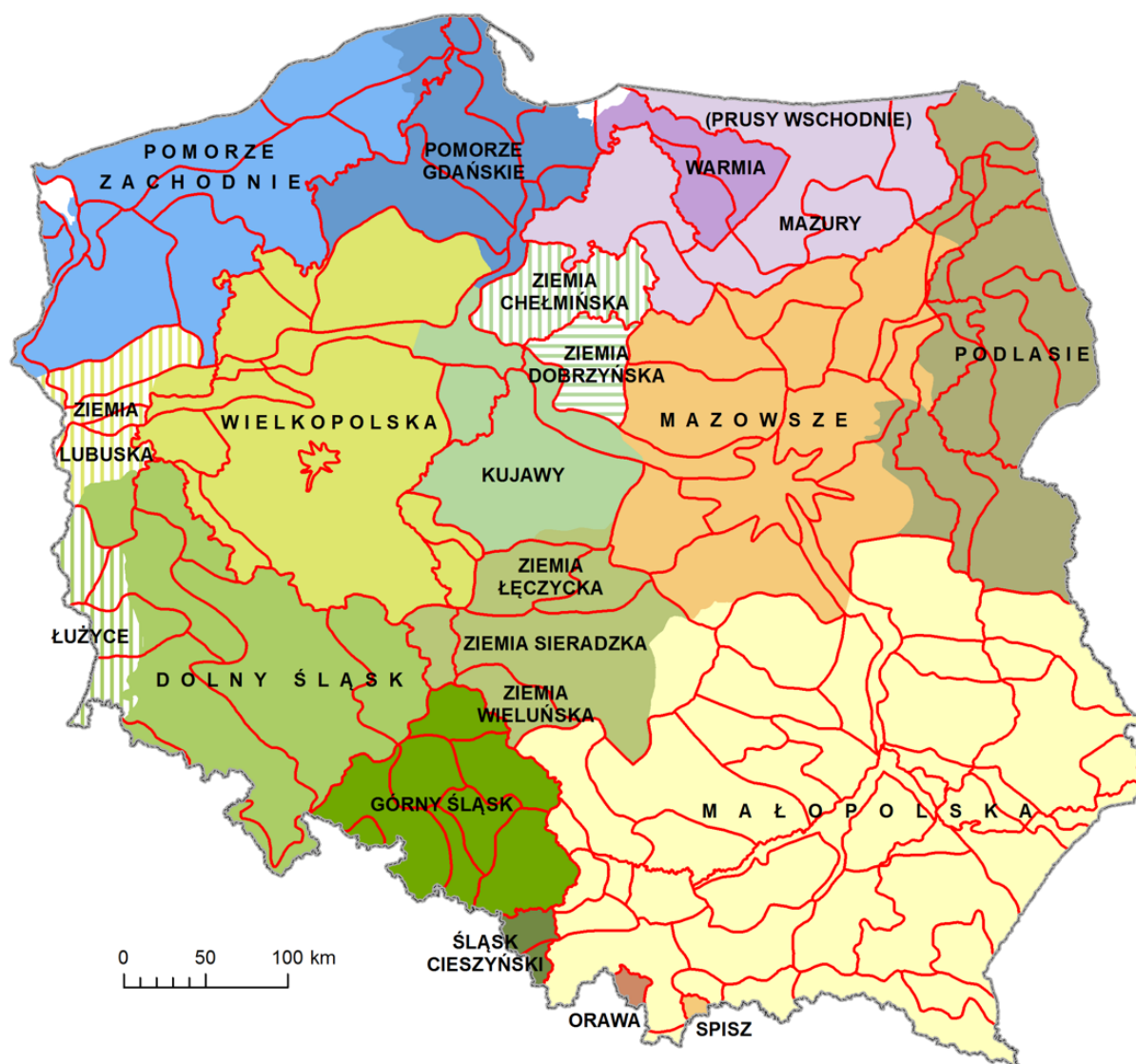
Ryc. 3. Regionalizacja historyczno-kulturowa Polski na tle regionów historycznych.

Granic dawnych regionów kulturowych (takich jak Wielkopolska, czy Mazowsze) doszukać się można, analizując obszary o jednorodnej strukturze osadniczej (dla łatwiejszej ich identyfikacji zasięg podkolorowano (ryc. 3.). Szczegółowy przebieg granic tych dawnych województw i wyróżnionych regionów bywa jednak odmienny, bowiem nieustannie zachodzące procesy polityczne, społeczno-kulturowe i gospodarcze modyfikują zasięgi, zacierają specyfikę obszarów.